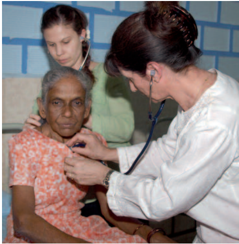
Untersuchung einer Patientin im Shri Kamaxidevi Homeopathic Medical College & Hospital in Goa

Das Praktikum in Indien ist ein fakultativer Bestandteil des